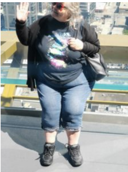
Voor onze dikkertjes