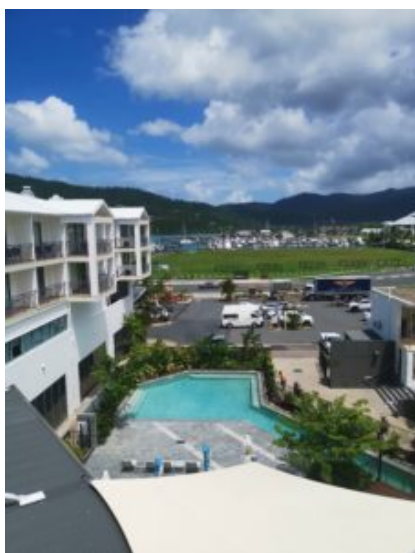
Uitzicht vanuit onze kamer

Vanuit het hotel hadden wij een prachtig uitzicht over de bergen. Soms wil je graag een kamer met uitzicht over zee, maar daar waren ze nog zo druk bezig met de hele kust weer opnieuw in te richten, dat we nu blij waren met een kamer aan de achterkant.