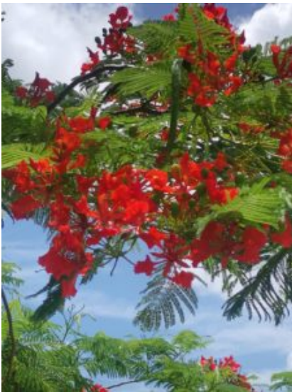
Prachtig bloeiende bomen en planten

Het leuke is als je in zo'n stadje loopt, dat je daar dan de leukste mensen tegenkomt.