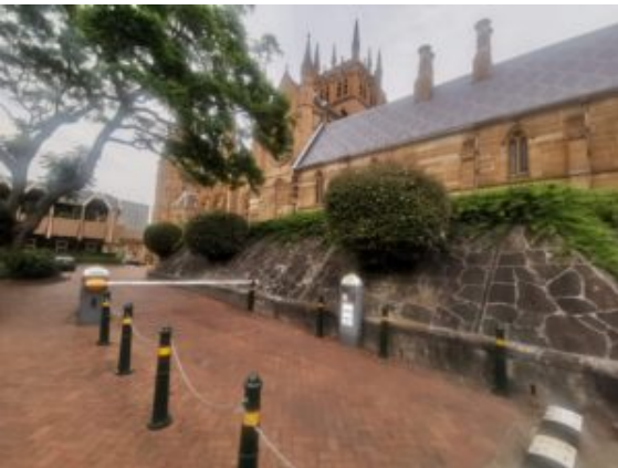
Mary's Cathedral met klooster