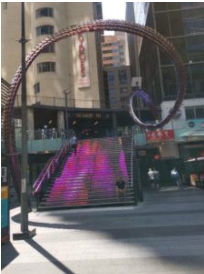
Natuurlijk onderweg een pauze om daar de nodige dingen te bekijken