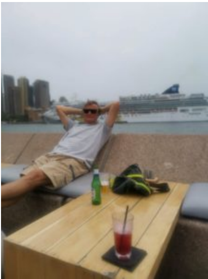
Een heerlijke pauze