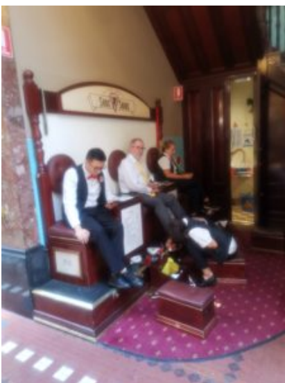
schoenen worden hier nog regelmatig op