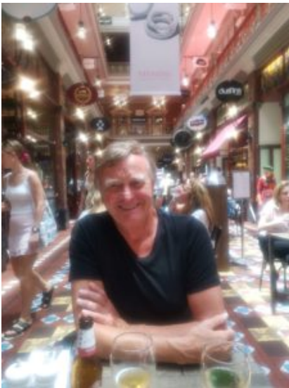
een lekker "lunsje"