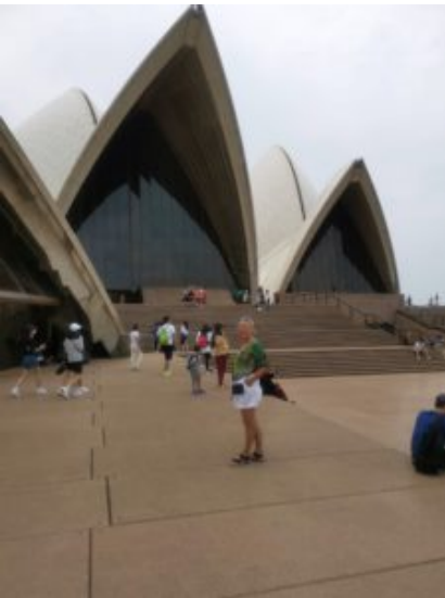
Wat een schitterend gebouw