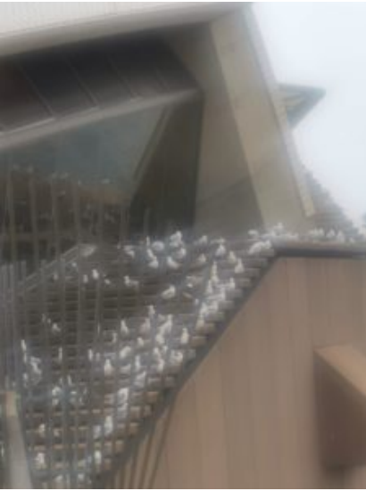
Alle duiven op deze dam