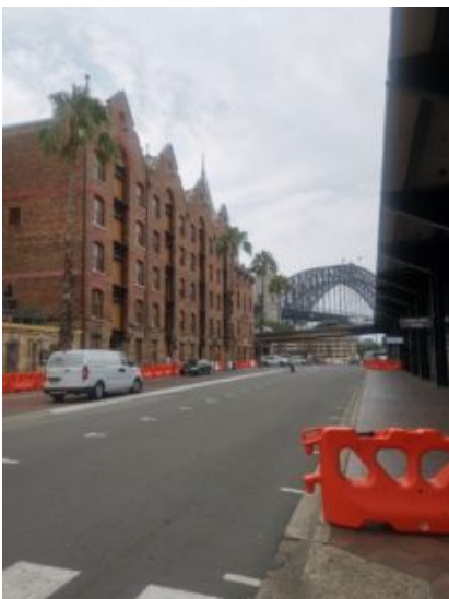
De eerste pakhuizen aan de kade