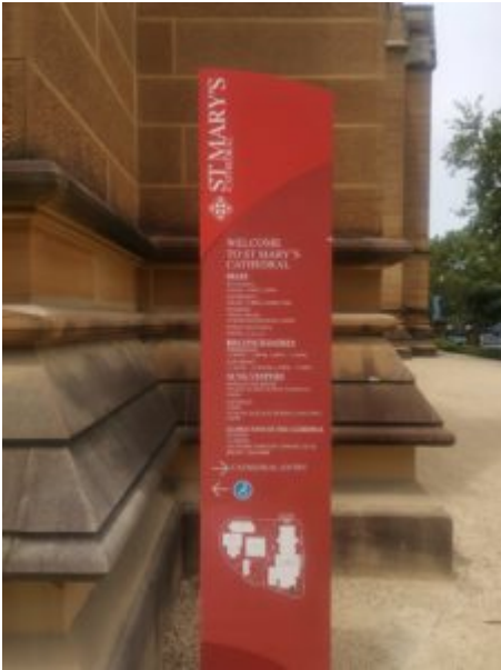
bij de botanische tuin