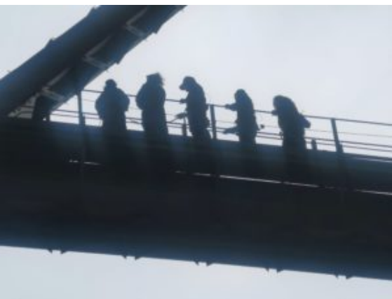
Iedereen was met safetybelts gezekerd, anders mag je niet mee