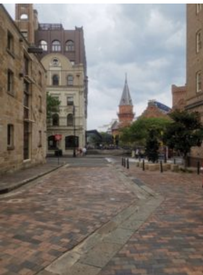
In dit straatje the Rock's waren de