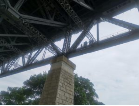
Het begin van de wandeling over de Harbour bridge