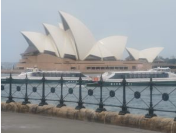
In de verte de Opera