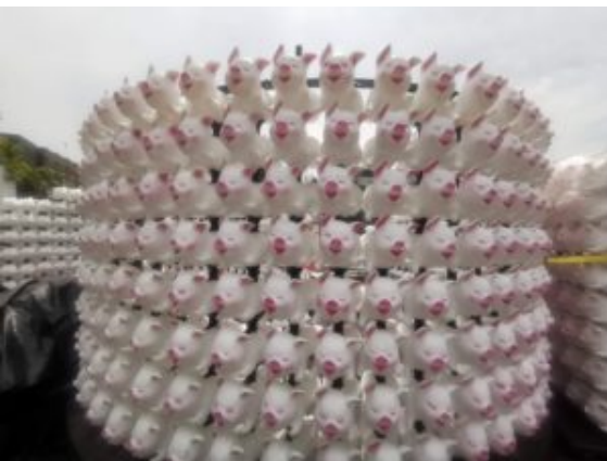
Zagen we regelmatig, allemaal zwijntjes