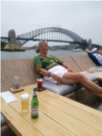
Even een welverdiende .....