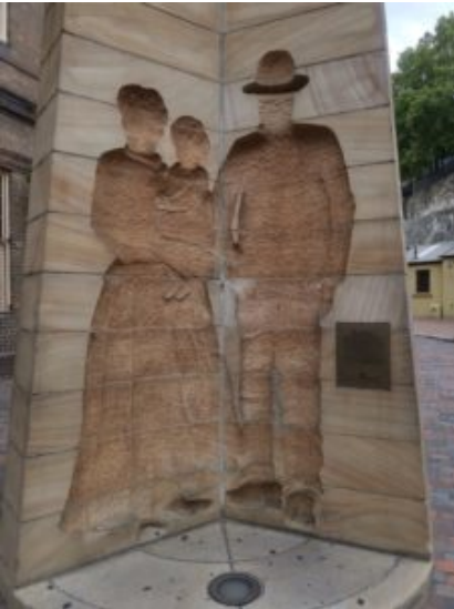
Drie prachtige beelden uitgehouwen in steen